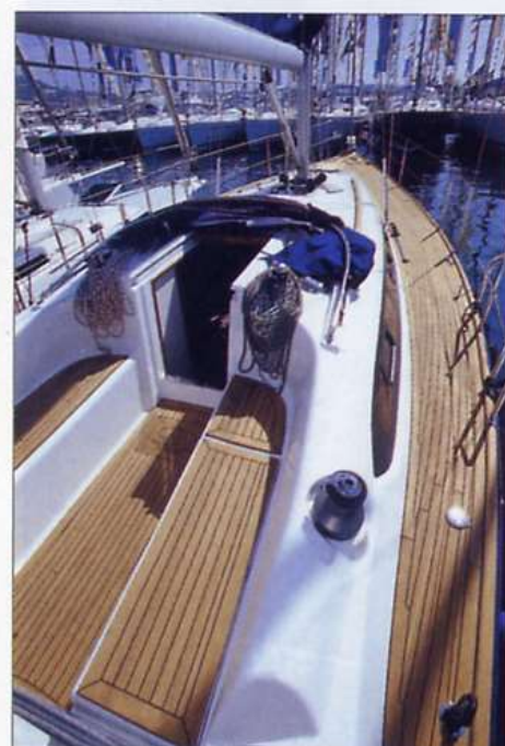
Sopra, il passavanti largo e libero da intralci. Le panche del pozzetto, rivestite in teak, offrono una comoda seduta a sei persone.